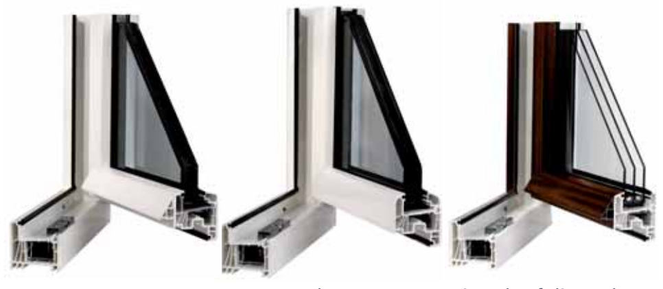
EuroFutur CLASSIC EuroFutur Elegance für Renovierung und Neubau