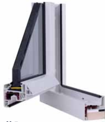
Kunststoff-Fenster „ALL-System“ für die Renovierung